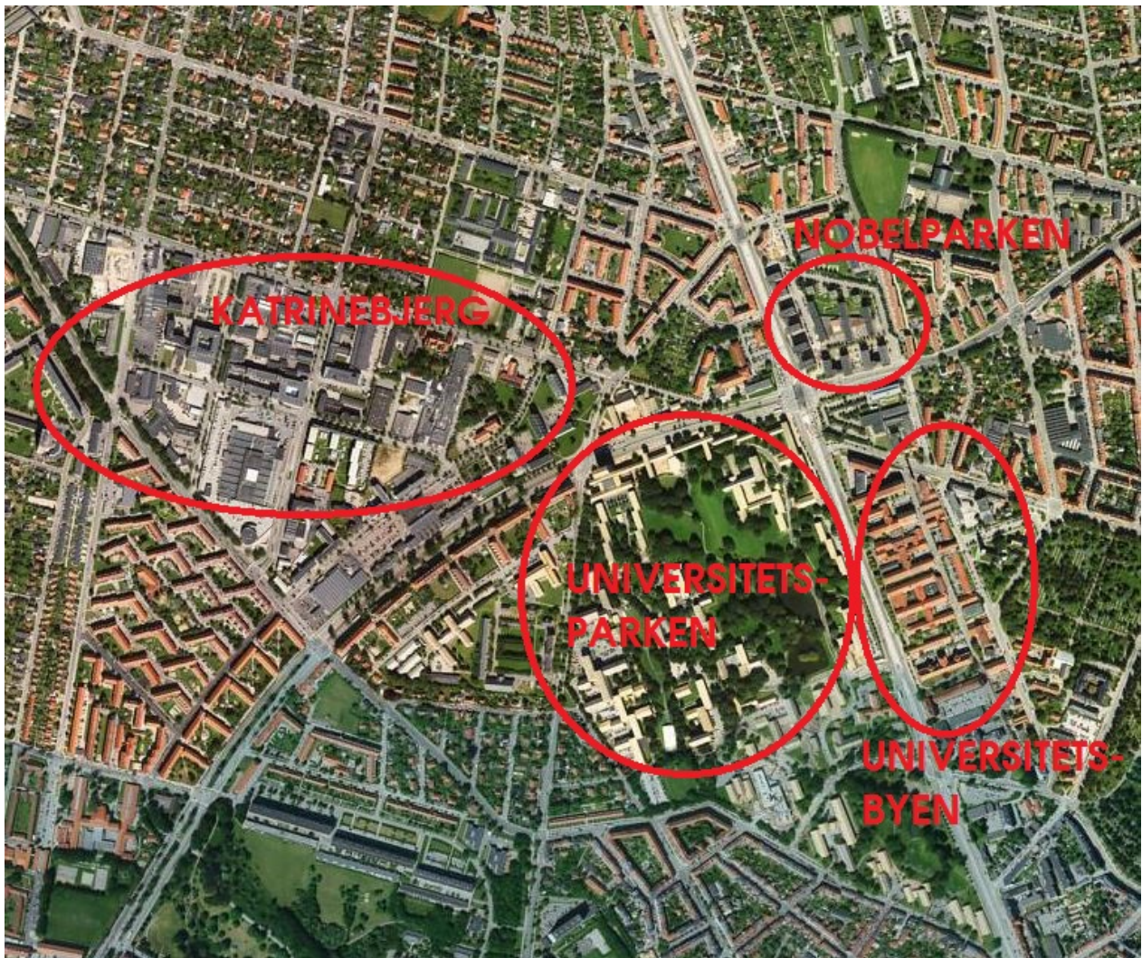
Katrinebjerg, Universitetsparken, Nobelparken og Universitetsbyen