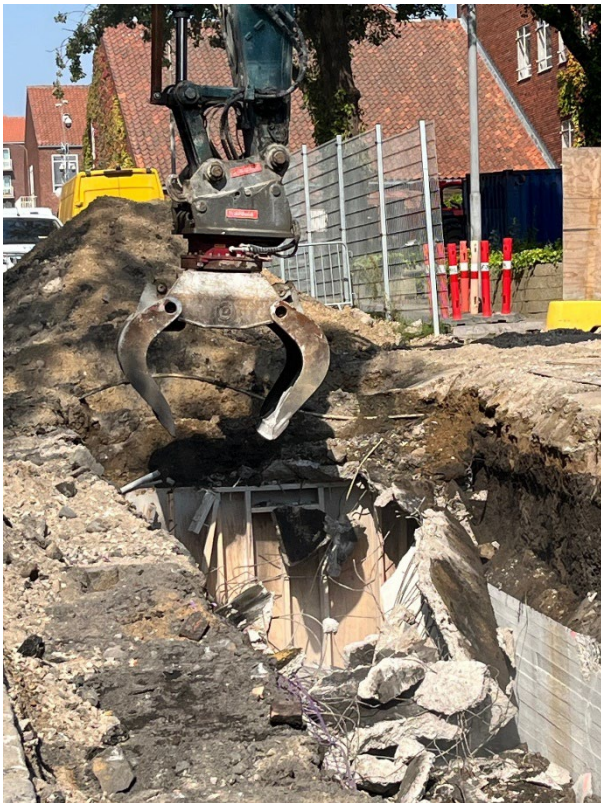
Figur 1: Den sidste hovedtunnel nedbrydes.