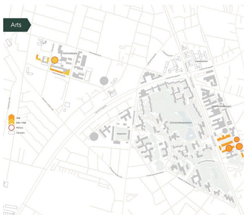
Oversigt over Arts' aktiviteter i fremtiden - AU

Fakultetet Arts samler sine aktiviteter fra Nobelparken, Kasernen, Tåsingegade og Trøjborgvej i den sydlige del af Universitetsbyen med en etapevis indflytning i perioden 2028 – 2031. Beslutningen er truffet med henblik på at skabe synlige og sammenhængende fagmiljøer, der understøtter en stærk, fælles identitet for både ansatte og studerende. Moesgaard vil fortsat være det naturlige centrum for antropologi og arkæologi, ligesom IT-uddannelserne på Arts får til huse sammen med de relevante fagmiljøer på Nat i et nyt højhus i Åbogade på Katrinebjerg. Læs mere om planerne for Arts og Campus 3.0 på AU's hjemmeside.