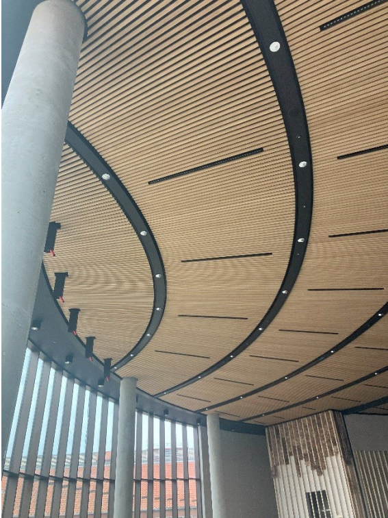
Udsnit af det flotte loft i det store auditorium i 1790

Arbejdet med auditoriet forsætter, og også indvendigt begynder det at tage form. Auditoriet, som er indeholdt i de ca. 40.000 m 2 ombygning og nybyggeri, der bliver lavet til Aarhus BSS, forventes at ibrugtages primo 2026.