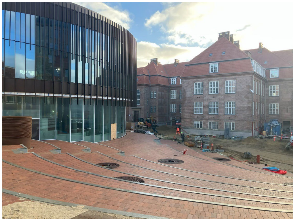
Pladsen ved auditoriet i 1790

Også på pladsen, som omkranser auditoriet, er udviklingen i fuld gang. Pladsen bliver indrettet, så der kan afholdes arrangementer på den, og der kommer til at være let adgang gennem den sydlige passage, når denne åbner.