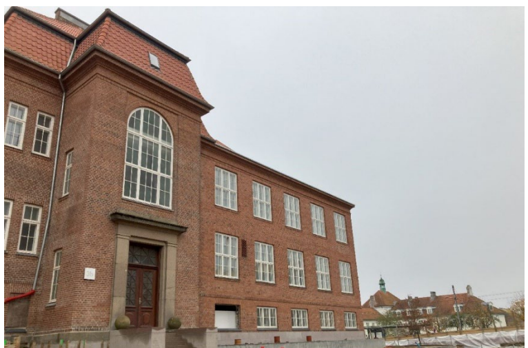
Bygning 1770 i den sydlige del af Universitetsbyen, som netop har undergået tagrenovering, ekstrafundering samt fået nye sokkelsten

Fakultetet Arts flytter størstedelen af sine aktiviteter til den sydlige del af Universitetsbyen, og i FEAS ser vi frem til at byde vores nye lejere og samarbejdspartnere velkomne. Arts forventes at lave en etapevis indflytning i perioden 2028 til 2031 i takt med, at den sydlige del af Universitetsbyen bliver udviklet.