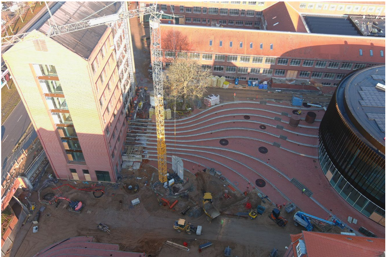
Oversigtsbillede af pladsen med bygning 1791 til venstre

Bygning 1791 opføres til brug af Aarhus BSS og Aarhus Universitets Forskningsfonds nyeste datterselskab, AU Cetera. Bygningen, som er otte etager høj – svarende til 30-35 meter – kommer foruden Aarhus BSS og AU Cetera til at huse en cafe, som bliver indrettet til fordel for de studerende på pladsen. Caféen bliver placeret i stueetagen. Bygningen har netop fået facademurværk.